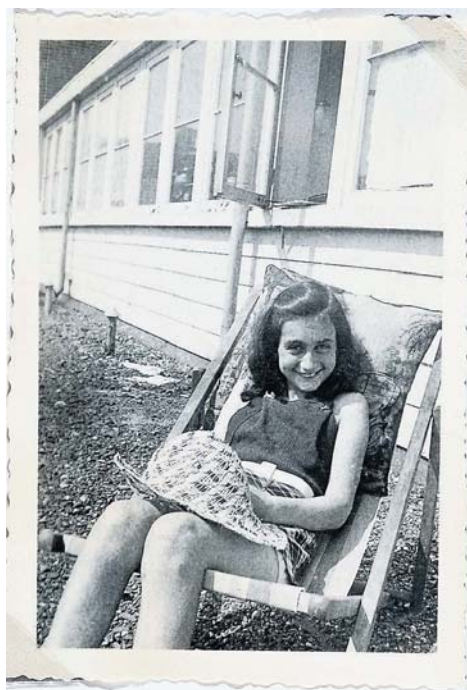
Anne Frank im Liegestuhl.